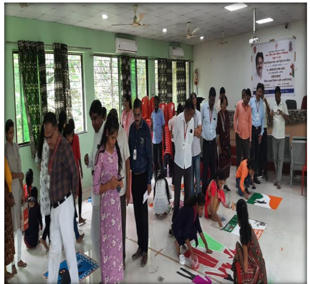
Rangoli Competition 21 August 2022