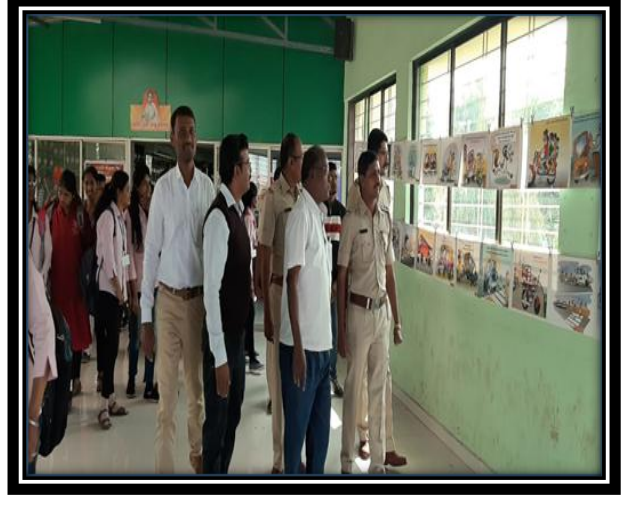
Program of Road Safety 22 Jan 2019-20