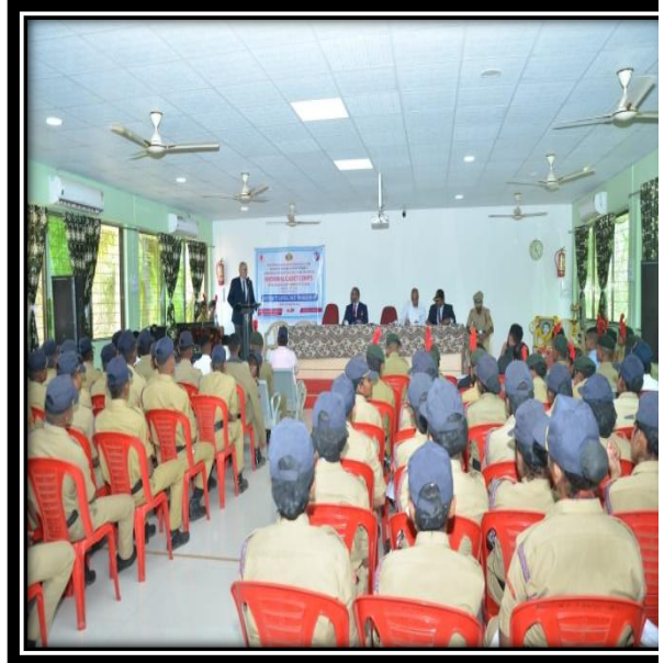
District Level Workshop Of NCC 10 th march 2020