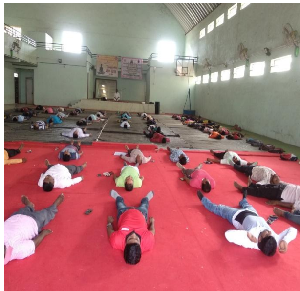
Program of Yoga Day 21 June 2019-20