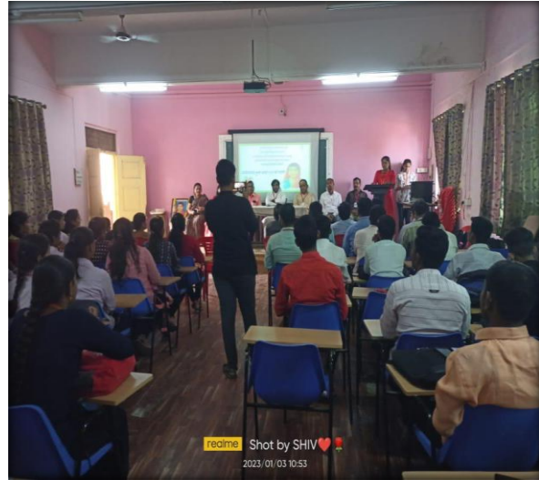
Birth Ceremony Savitribai Phule 03 Jan. 2022