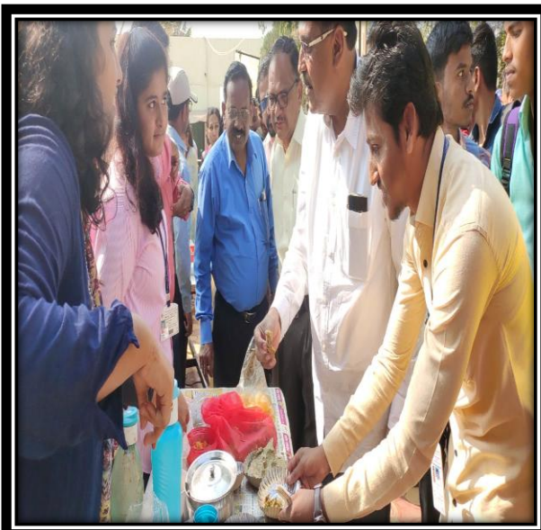
Program of Food Festival 28 jan2019-20