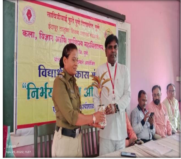
Nirbhay Kanya Abhiyan 25Nov 2022