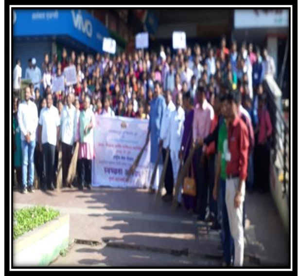
Cleaning Campaign 01 October 2019-20