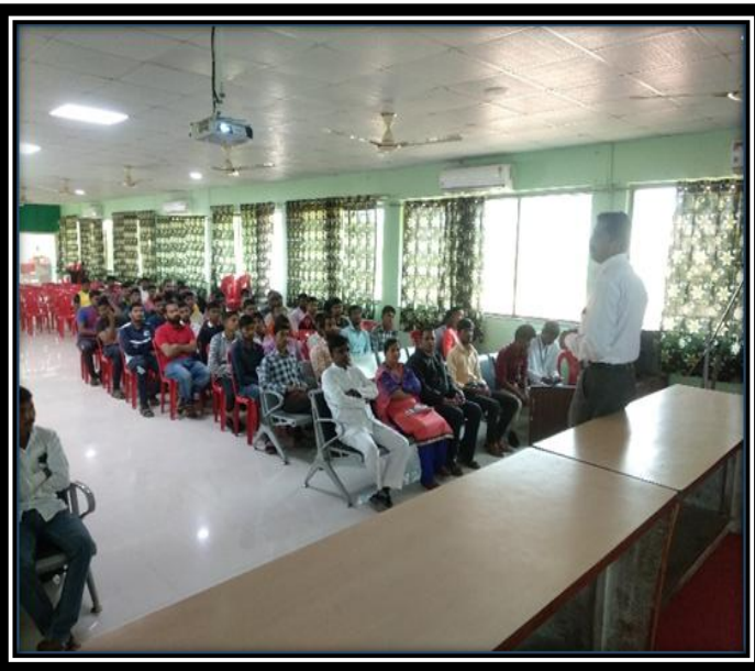
World Wetland Day 02 Februarys2020