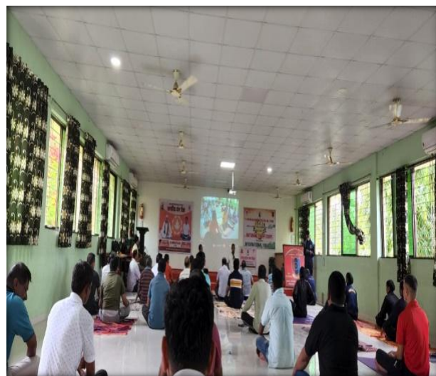
Program of Tree Plantation 5 June 2022