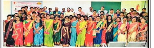
इंदोपुर येथील कला, विज्ञान आणि खाणिक्य महाविद्यालयात आंतरराष्ट्रीय महिला दिन उत्साहात साजरा करण्यात आला.