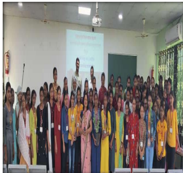
Program of Tree Plantation 5 June 2022