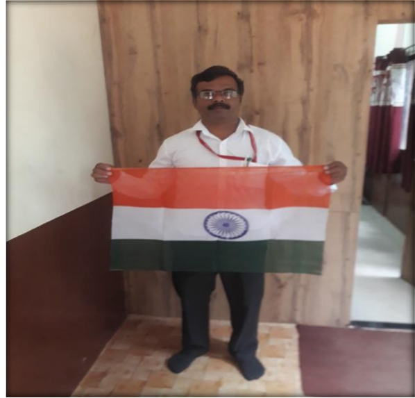
Har Ghar Titnga 13-18-August 2022