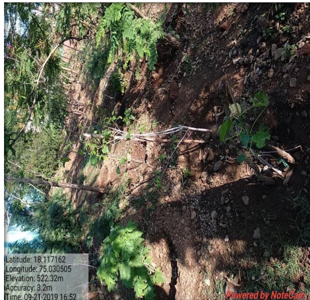
Program of Tree Plantation 5 June 2022-23