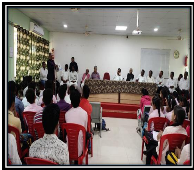
Skill of News Writing 06 Jan 2020