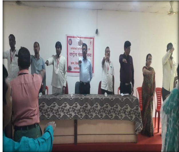
Campaign of Voters day 25 Jan 2022-23