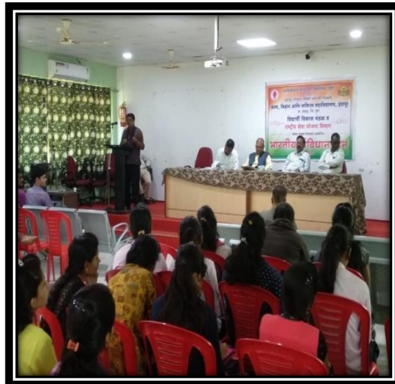
Constitution Day 26 November 201-20