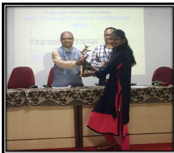
Disability Day 03December 2019-20