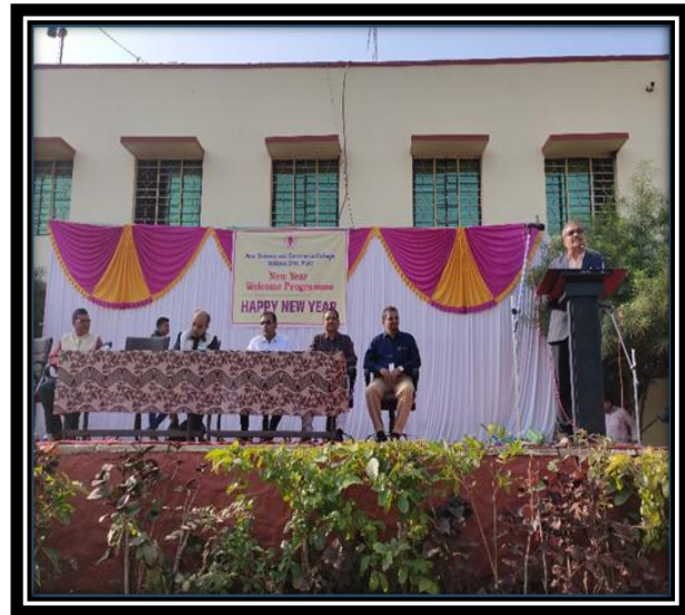
Program Welcome of New Year 1 st January 2020