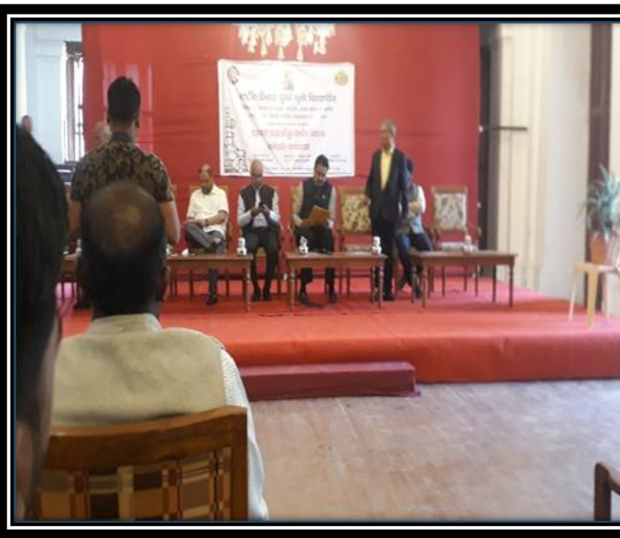
Lecture on Role of Cooperative Movement (SPPU) 22 Feb -2019-20