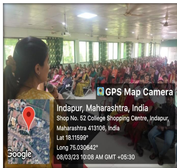
International Women's Day 08 March 2023