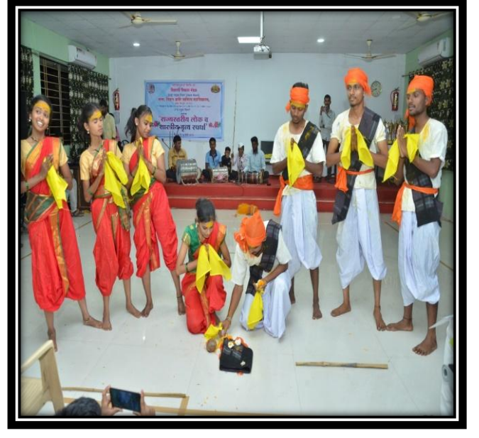
State Level Dance Competition 06-07 March 2020