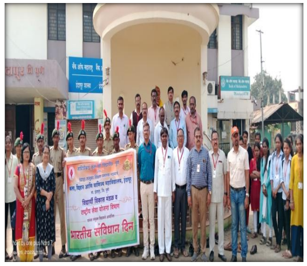
Sanvidhan Rally 26 Nov. 2022