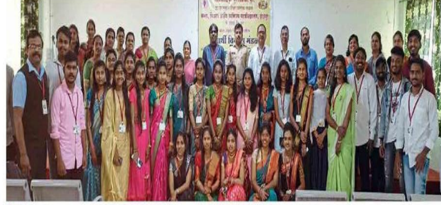
इंदापूर : महाविद्यालय येथे निर्भय कन्या उपक्रमांतर्गत कार्यशाळेस उपस्थित मान्यवर.

इंदापूर महाविद्यालय येथे सावित्रीबाई फुले पुणे विद्यापीठ, पुणे विद्यार्थी विकास मंडळ व कला विज्ञान वाणिज्य महाविद्यालय इंदापूर यांच्या