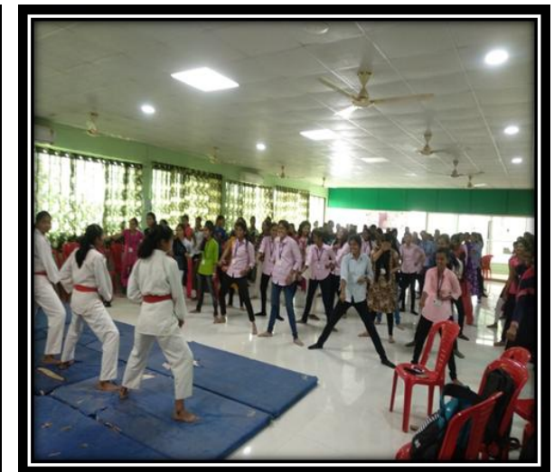
Nirbhaya Kanya Abhiyan 25Nov 2019-20